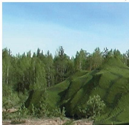
Рис. 1. Маскировочный комплект МРПК-1Л