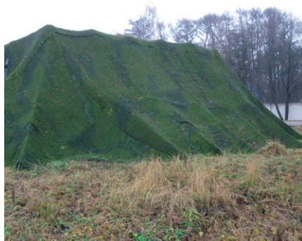
Рис. 3. Защитно-маскировочный экран

микропровода для скрытия от средств разведки противника и защиты военной техники (ВВТ) от современных средств поражения, действующих из верхней полусферы, в том числе и высокоточного оружия (ВТО).